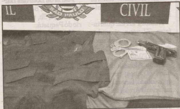
Foram achados colete balístico, colete da Civil, algemas e arma

De acordo com o soldado Carlos, por volta das 13h30 de ontem, a viatura trafegava pela esquina da Avenida Santos Dumont com a Rua São Jorge, no Pae Cará, em Vicente de Carvalho, quando populares informaram que ali perto havia um rapaz armado com uma capa preta.